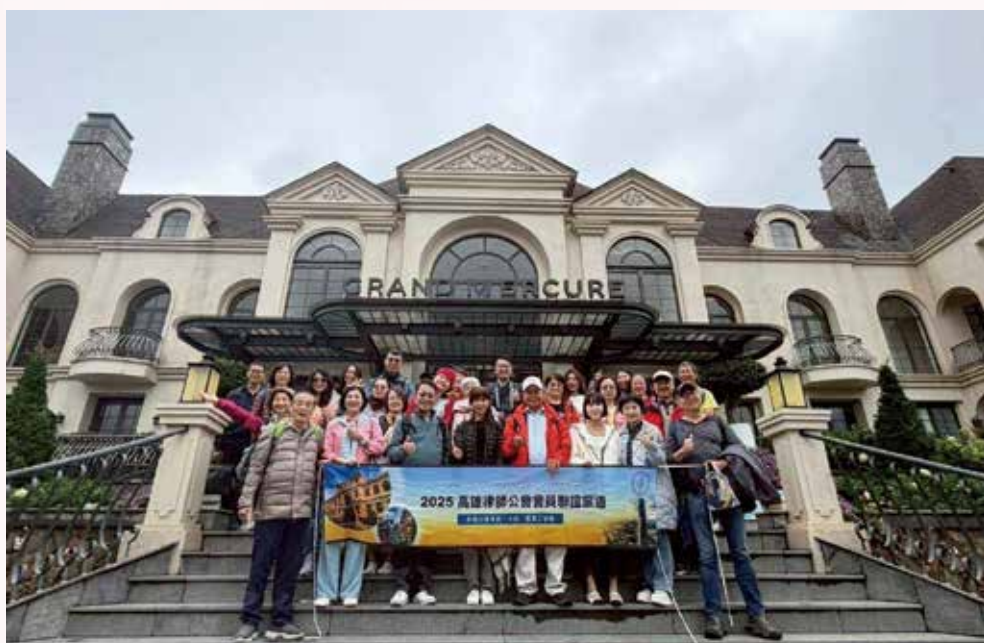
◀ 114 年 11 月 7 日本會 114 年國外旅遊【越綺麗・穿越山海芽莊、大叻、西貢三城戀 6 日】律師寶眷於【Mercure Dalat Resort 飯店】合影。