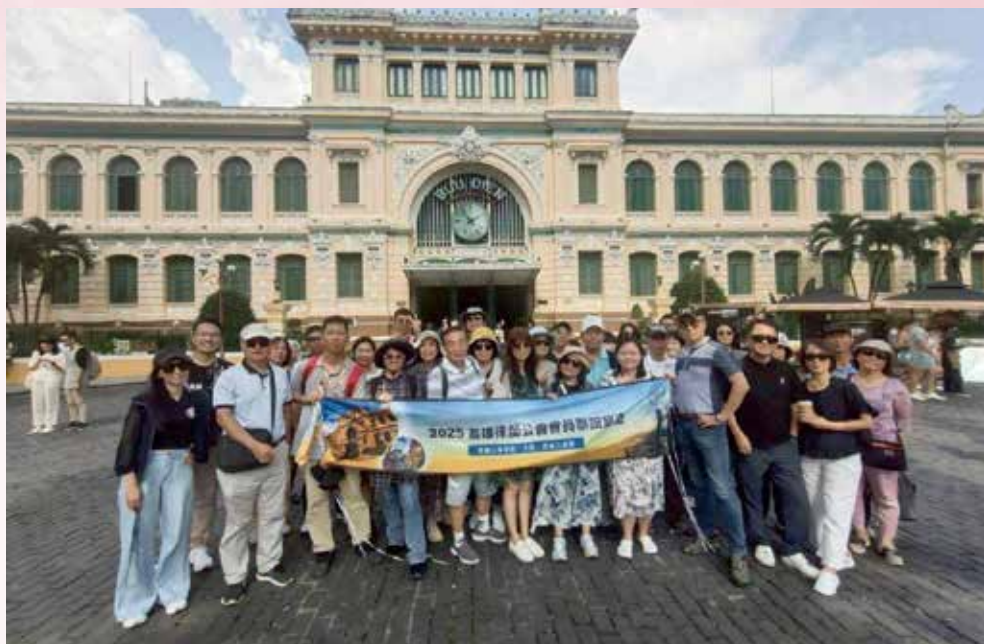
◀ 114 年 11 月 9 日本會 114 年國外旅遊【越綺麗・穿越山海芽莊、大叻、西貢三城戀 6 日】律師寶眷於【胡志明市百年郵局】合影。