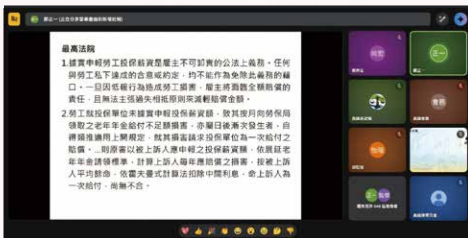
▲◀ 114 年 12 月 4 日本會 114 年度勞動律師專業課程培訓班第 10 堂視訊課程，邀請鄭正一老師，主講「勞工保險、勞工職業災害保險及保護法及勞工退休金常見勞資爭議類型（民事、刑事及行政責任部分）」。