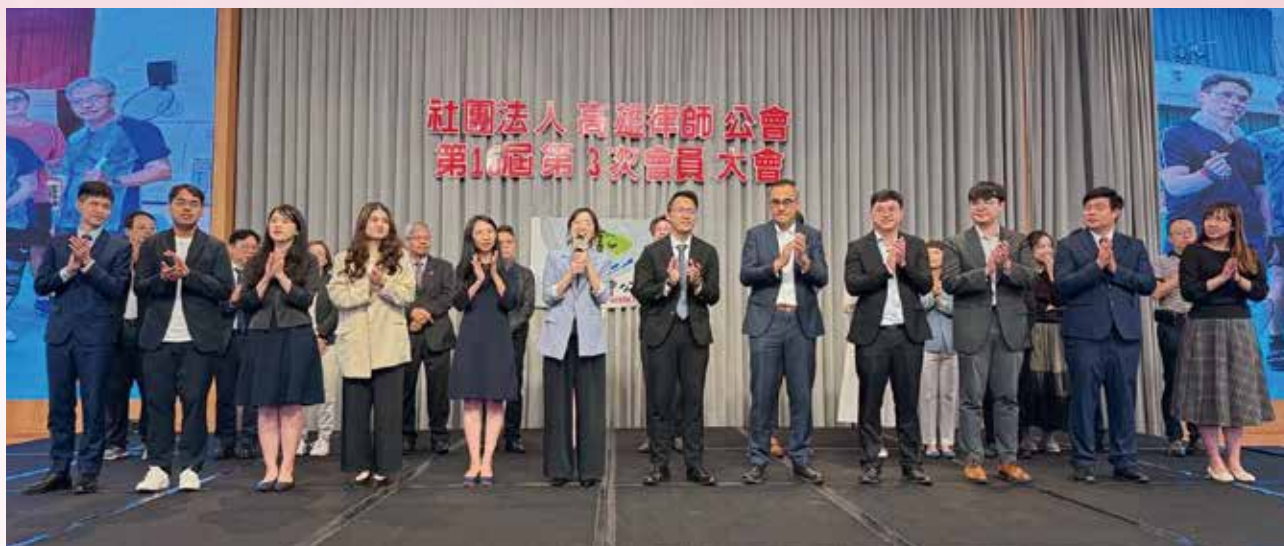
▲ 114 年 11 月 22 日本會第 16 屆第 3 次會員大會 - 全體副秘書長合影。