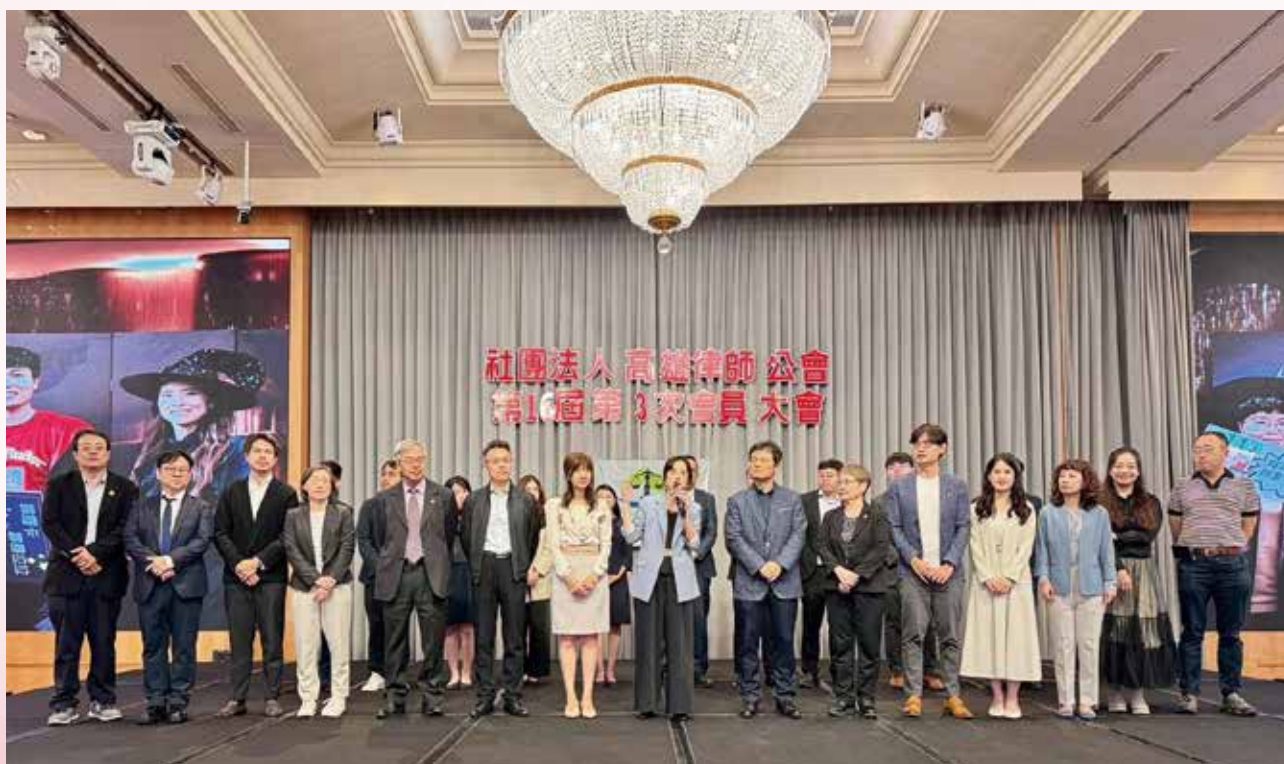
▲ 114年11月22日本會第16屆第3次會員大會 - 全體理監事合影。