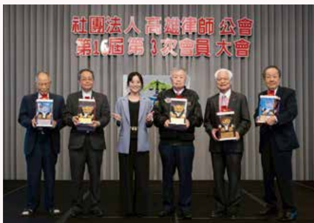
▲► 114年11月22日本會第16屆第3次會員大會 - 頒發資深會員獎合影。