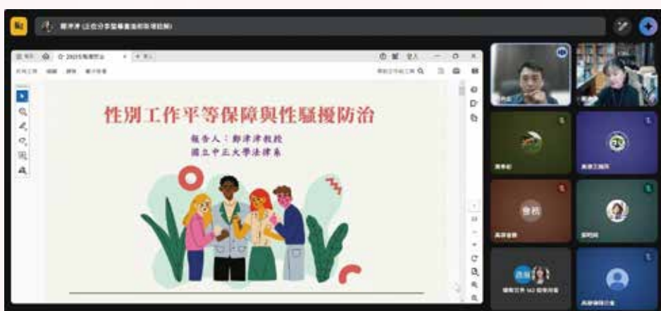
◀▼ 114 年 11 月 20 日本會 114 年度勞動律師專業課程培訓班第 8 堂視訊課程，邀請鄭津津老師，主講「性別工作平等保障與性騷擾防治」。