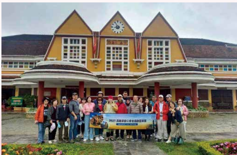
◀ 114 年 11 月 7 日本會 114 年國外旅遊【越綺麗・穿越山海芽莊、大叻、西貢三城戀 6 日】律師寶眷於【大叻百年火車站】合影。