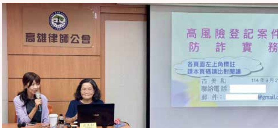
▲◀ 114年9月27日本會與財團法人法律扶助基金會橋頭分會共同辦理律師在職進修，邀請古美和助理教授，主講「不動產登記實務」。