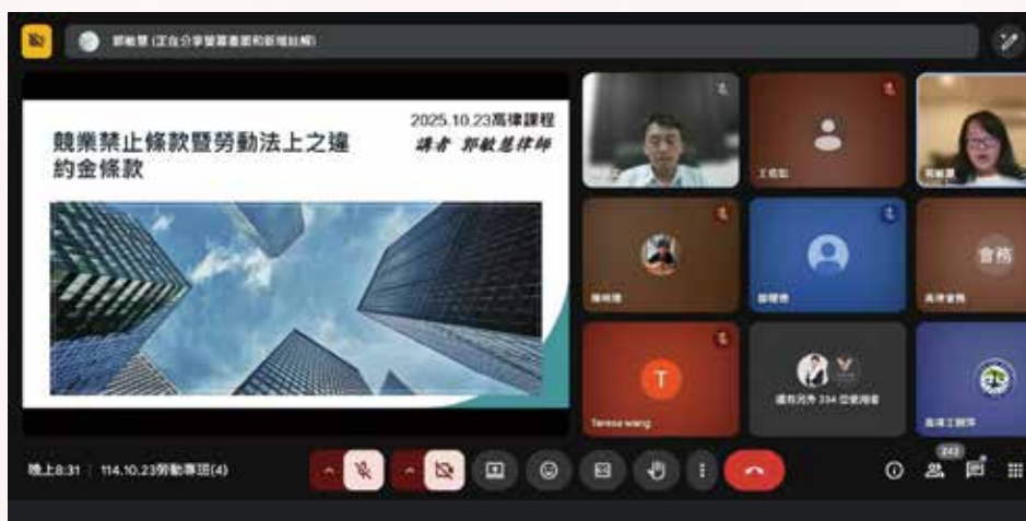
▲◀ 114 年 10 月 23 日本會 114 年度勞動律師專業課程培訓班第 4 堂視訊課程，邀請周兆昱老師、郭敏慧律師，主講「最低服務年限、競業禁止約款及調職與違約金條款」。