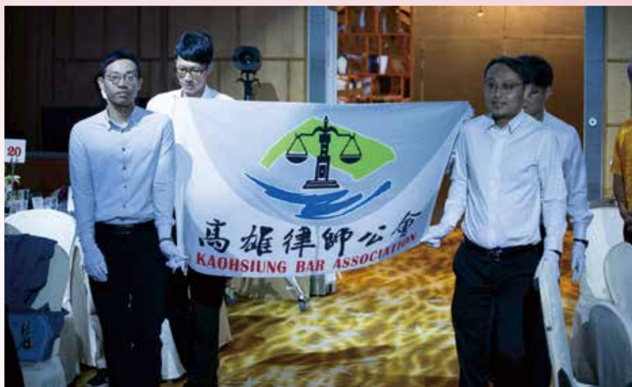
◀▼ 114 年 11 月 22 日本會第 16 屆第 3 次會員大會 - 會旗進場。