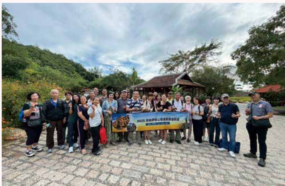
◀ 114 年 11 月 4 日本會 114 年國外旅遊【越綺麗-穿越山海芽莊、大叻、西貢三城戀 6 日】律師寶眷於【I-RESORT 熱礦泥浴水療會館】(泥漿浴)合影。