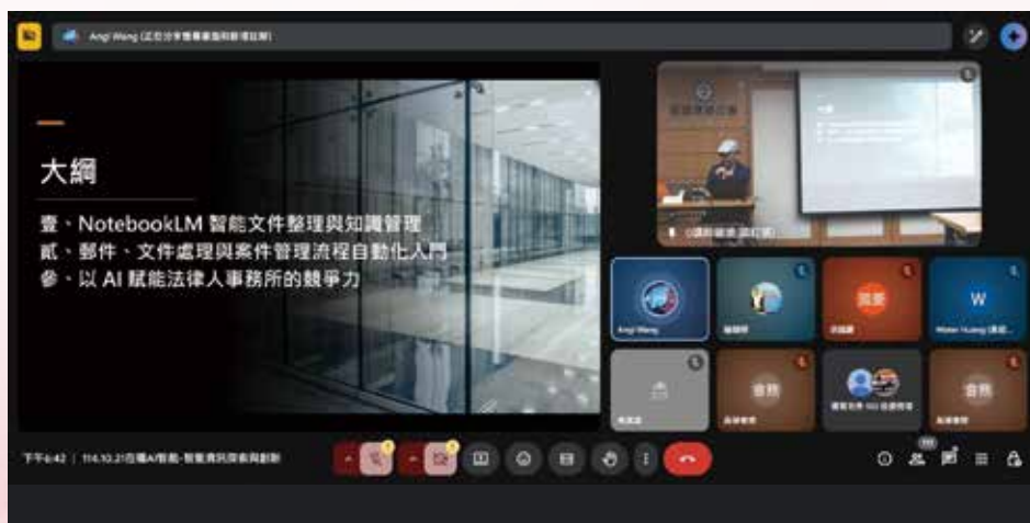
▲◀ 114 年 10 月 21 日本會資訊暨人工智慧發展委員會主辦、律師在職進修委員會，邀請王恩琦老師主講「AI 智能 - 智能資訊探索與創新」。