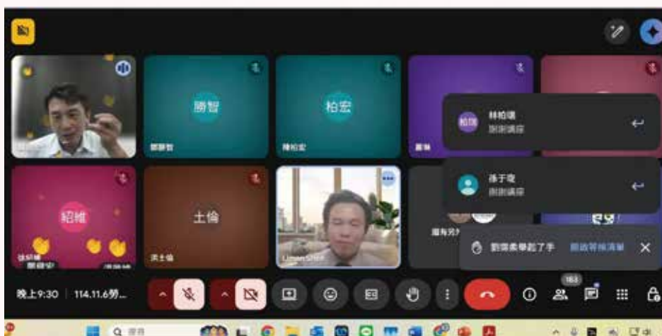
▲◀ 114 年 11 月 06 日本會 114 年度勞動律師專業課程培訓班第 6 堂視訊課程，邀請沈以軒律師，主講「工資專題（工資及非工資的理論與實務）」。