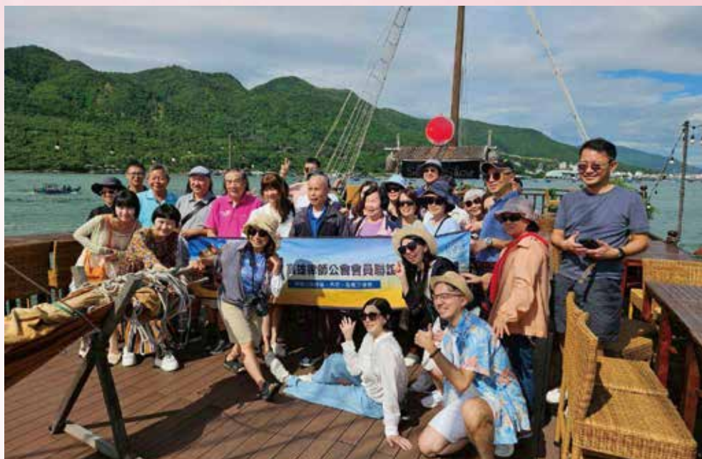
◀ 114 年 11 月 5 日本會 114 年國外旅遊【越綺麗-穿越山海芽莊、大叻、西貢三城戀 6 日】律師寶眷於【皇帝號郵輪】(出海一日遊)合影。