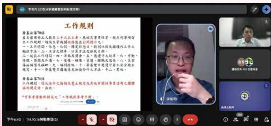
▲◀ 114 年 10 月 16 日本會 114 年度勞動律師專業課程培訓班第 3 堂視訊課程，邀請李佑均律師，主講「勞動契約(二)(包括工作規則制定及勞動契約終止，勞基法第 11、12、14 條及合意終止)」。