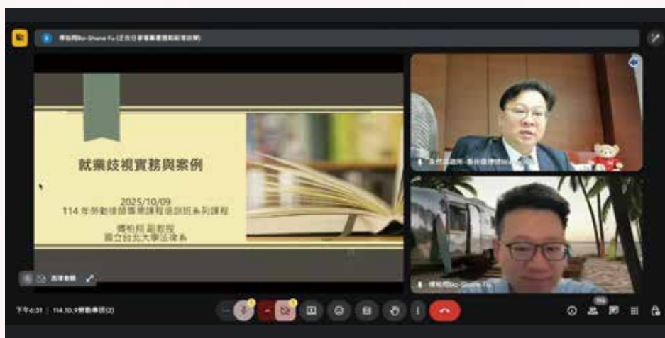
▲◀ 114 年 10 月 9 日本會 114 年度勞動律師專業課程培訓班第 2 堂視訊課程，邀請傅柏翔老師主講「就業歧視及不法侵害（職場霸凌）」。