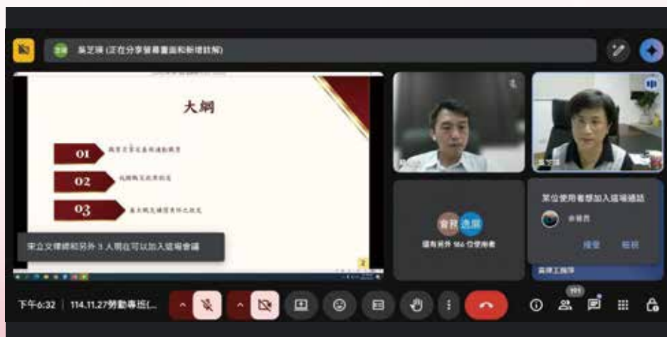
▲◀ 114 年 11 月 27 日本會 114 年度勞動律師專業課程培訓班第 9 堂視訊課程，邀請吳芝瑛法官，主講「職業災害（含通勤職災）補賠償相關專題」。