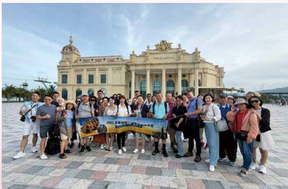
▲ ◀ 114 年 11 月 5 日本會 114 年國外旅遊【越綺麗-穿越山海芽莊、大叻、西貢三城戀 6 日】律師寶眷於【珍珠島】(纜車、動物園、世界花園等)合影。