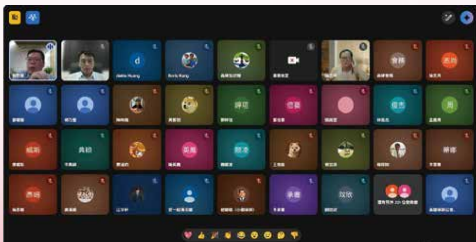
▲◀ 114 年 10 月 30 日本會 114 年度勞動律師專業課程培訓班第 5 堂視訊課程，邀請程居威律師，主講「工時專題（包括工時認定、法定工時、延長工時、變形工時）」。