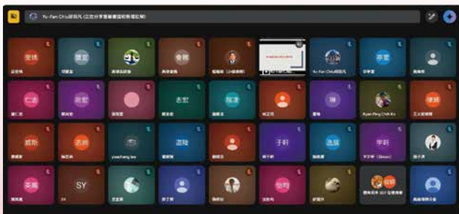
▲◀ 114 年 11 月 13 日本會 114 年度勞動律師專業課程培訓班第 7 堂視訊課程，邀請邱羽凡老師，主講「勞動契約（三）（包括：試用期、非典型勞動及勞動派遣）」。